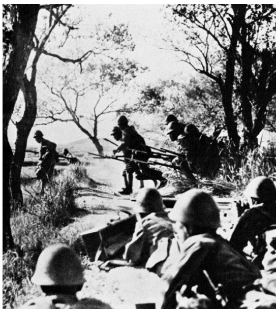
Японские солдаты поднимаются в атаку. Пулеметчики готовы оказать огневую поддержку атакующим. Бирма, 1942.

1-й Батальон 215-го Полка японцев выдвинулся из джунглей и атаковал деревню Ситтанг в 8 утра 22 февраля. Столкнувшись с неожиданным сопротивлением, командир передовой роты атакующих принял решение занять Высоту 135 , также именуемую Холм Будды (Budda Hill), которая доминировала над деревней и подходами к мосту. Еще одна высота – Холм Пагода (Pagoda Hill) - находилась между японцами и мостом. Японцы предприняли попытку обойти ее и захватить мост. 4-й Батальон 12 Полка Приграничных Сил и рота 2-го Батальона Полка Герцога Веллингтонского (Duke of Wellington's Regiment) контратаковали противника, отогнали его от высоты Пагода и начали теснить вверх по склонам высоты Будда, однако были вынуждены отойти под огнем противника. Японцы перебросили подкрепления на высоту Будда, и выбить их оттуда не представлялось возможным, однако их первая попытка захватить мост потерпела неудачу.