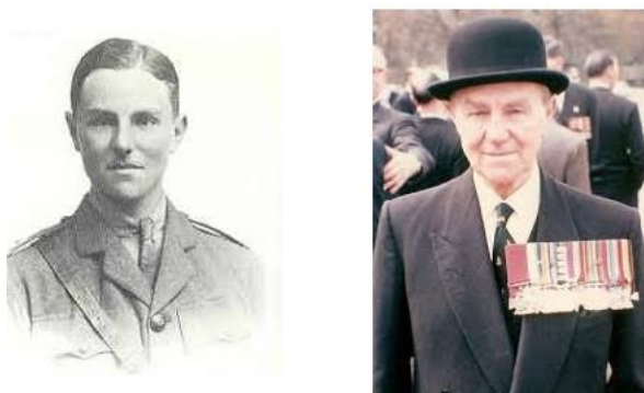
Джон Смайт в молодости (слева - http://www.espncricinfo.com/india/content/player/34438.html ) и на склоне лет (справа - https://en.wikipedia.org/wiki/Sir_John_Smyth,_1st_Baronet )

После катастрофы на реке Ситтанг в составе дивизии осталось 3 484 пехотинца, представлявших собой 41% штатной численности. Но большинство батальонов имели численность значительно ниже штатной еще до этих боев, и реальные потери оказались значительно меньшими, чем можно было ожидать. Однако пушки, транспортные средства и большая часть оружия были потеряны, и 17-я Дивизия, на какой-то момент времени, прекратила существование как эффективная боевая часть. Истинная трагедия этой короткой и тяжелой кампании заключается в том, что основное сражение [в обороне] за барьером реки Ситтанг ... так и не состоялось.