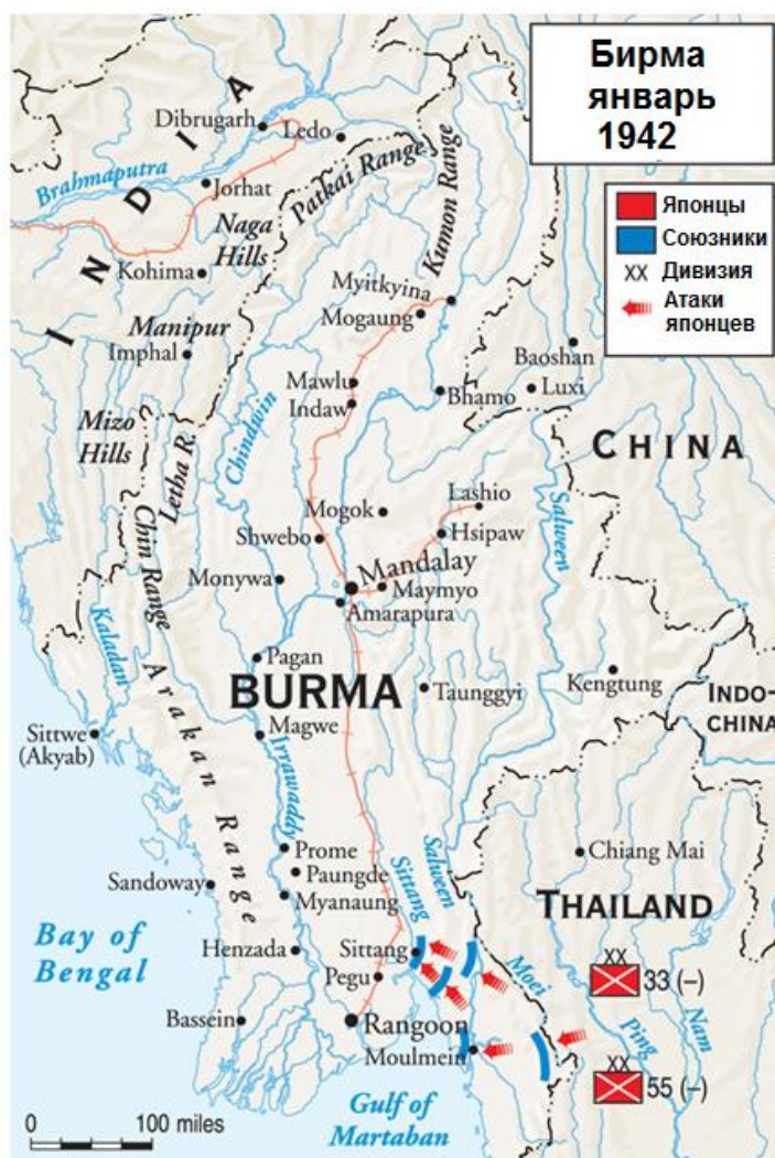
Ситуация на Бирманском фронте в январе-феврале 1942 года