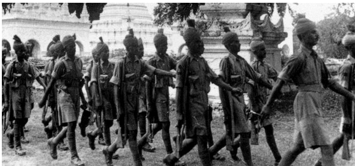
Солдаты 17-й Индийской Дивизии. Ее трагическая судьба до сих пор остается предметом дискуссий...