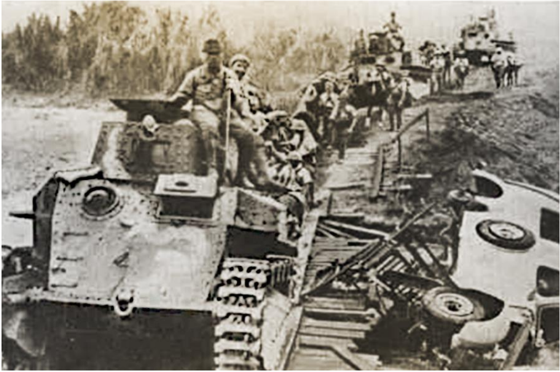
Японская бронетехника форсирует водную преграду по временному мосту на ранней стадии вторжения Императорской Армии в Бирму.