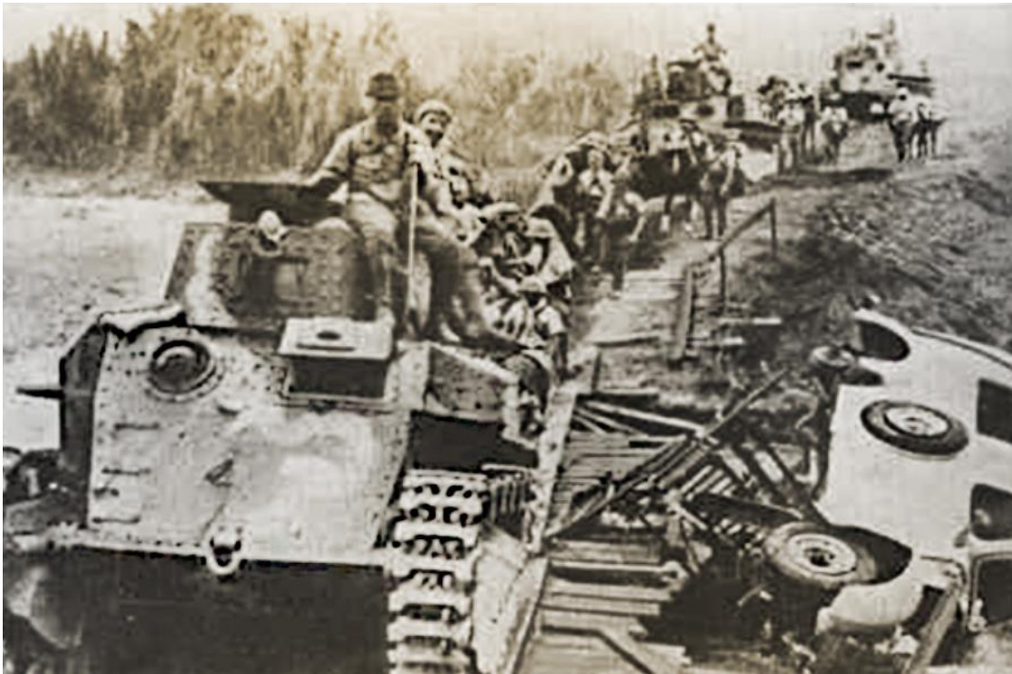
Японская бронетехника форсирует водную преграду по временному мосту на ранней стадии вторжения Императорской Армии в Бирму.