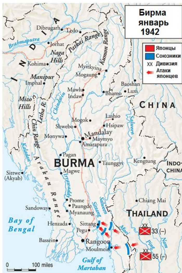
Ситуация на Бирманском фронте в январе-феврале 1942 года