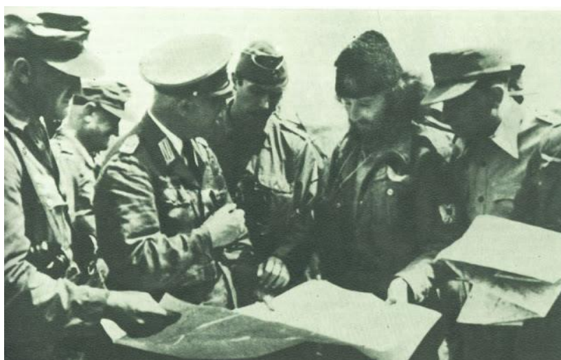
Четники обсуждают план совместных действий с немцами. 1944 г.