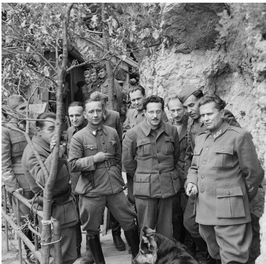
Тито, его кабинет министров и генеральный штаб. 14 мая 1944 г.

Я занимался многим, преимущественно работал в разведке, что было обусловлено моим знанием иностранных языков. Я читал захваченные немецкие документы, допрашивал пленных и переводил релизы, выпускаемые союзниками для Тито и полевых командиров. Позднее, в 1944 г., я стал служить в личной охране Тито.