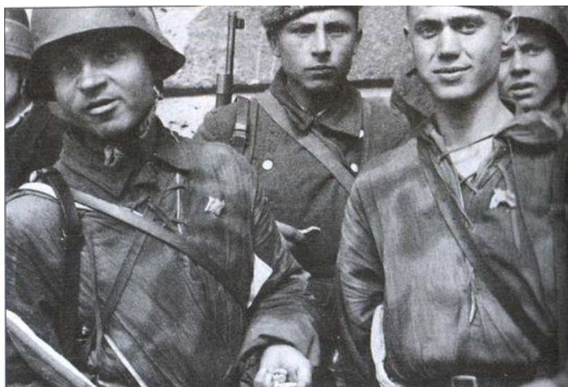
Солдаты РОНА в Варшаве ( http://www.e-reading.mobi/bookreader.php/1003624/Kovtun_Ivan_-_Russkie_esesovcy.html )

Мы начали ощущать последствия минометного и пулеметного обстрела, который вели эсэсовцы из своих огневых точек в здании бывшей Школы Политических Наук. Вечером наша группа еще раз собралась в квартире Занецки на совет. Ситуация была оценена как безнадежная. Продолжение боя в изолированной точке не имело смысла и шансов на успех. Наш единственный шанс выжить и продолжить борьбу заключался в прорыве в центр города, откуда мы сможем услышать и увидеть, где продолжается основное сражение. Оттуда мы сможем попытаться соединиться с более крупным подразделением повстанцев. Однако, уйти из осажденного здания было невозможно. Единственный путь отсюда лежал через каналы городской канализации, хотя точное направления движения было нам неизвестно. Более того, тоннель, ведущий из нашего подвала к вертикальному стволу, спускающемуся к канализационной системе, не был закончен. Мы решили наладить связь с бойцами, находящимися в других частях жилого комплекса со стороны улиц Wawelska и Pluga , где в тот момент пробивали проход к канализации. Мы тронулись в путь, и Януш обронил мрачное замечание: «Это будет божий дар, если мы отсюда вырвемся». Невысокий, но боевитый Янушек добавил: «Дела не бывают настолько плохи, что уже не может быть хуже!».