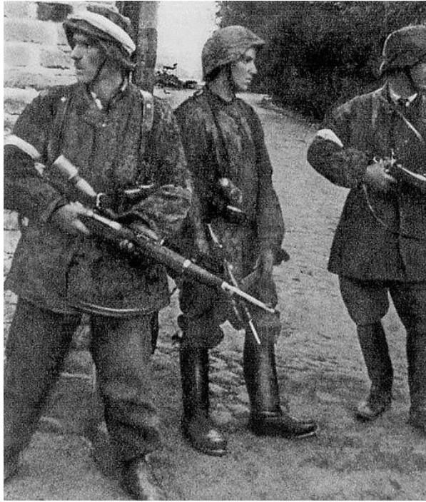
Повстанцы из батальона Parasol