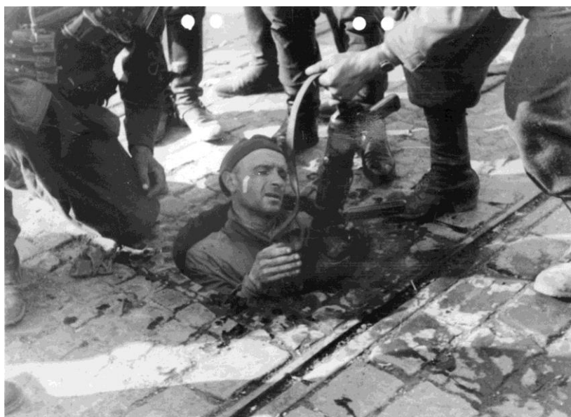
1944 September - Oktober