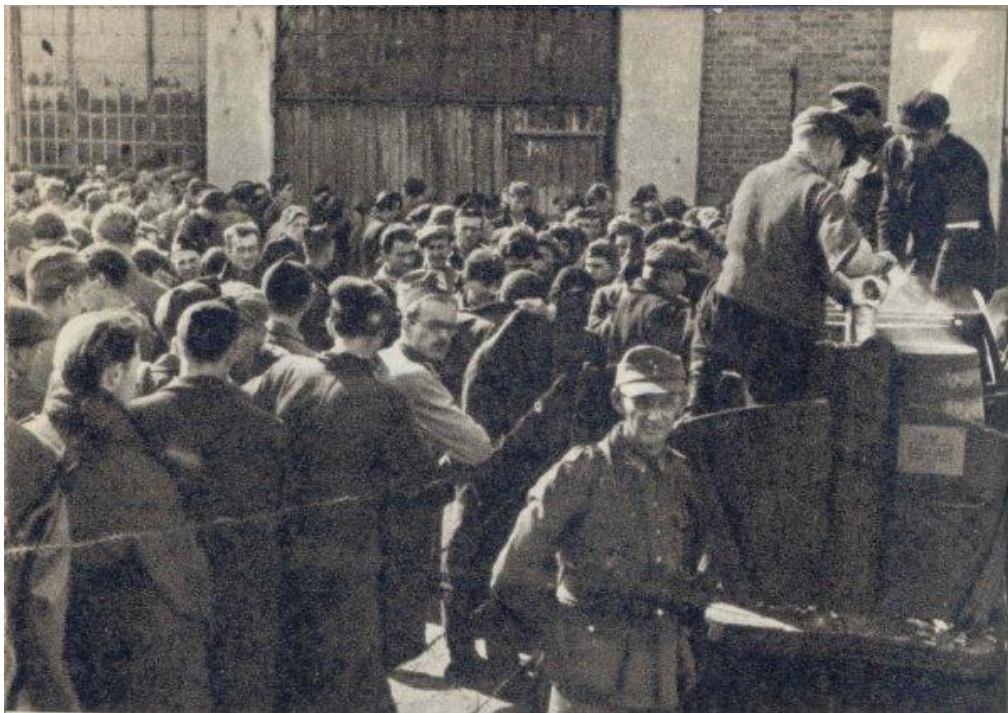
Прушков. Капитулировавшие поляки у полевой кухни ( http://www.sppw1944.org/index.html?http://www.sppw1944.org/powstanie/powstanie_oboz_ru.html )