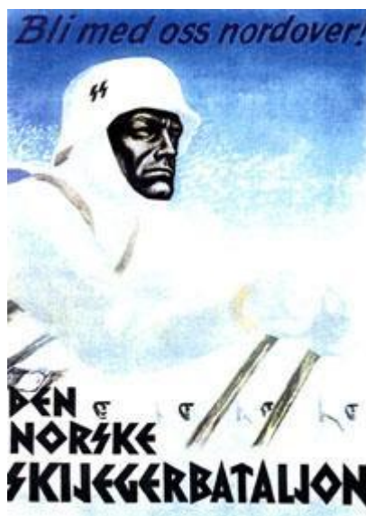
Плакат лыжного батальона норвежских СС

Остатки батальона были переформированы в 506 SS-Panzer-Grenadier-Battalion в Осло. Оставаясь под командованием Frode Halle . Это была последнее и единственное вооруженное подразделение норвежских СС на территории Норвегии, которое теперь составляло личную охрану Квислинга.