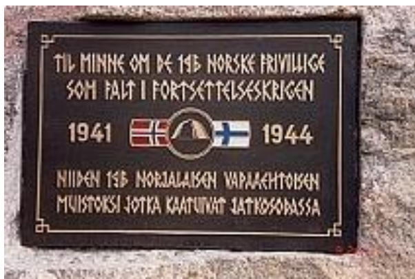
Мемориальная плита на немецком военном кладбище в Rovaniemi, Финляндия. Примерный перевод: Памяти 196 норвежских добровольцев, погибших во время Войны-Продолжения (финское название боевых действий в 1941-45 гг.)