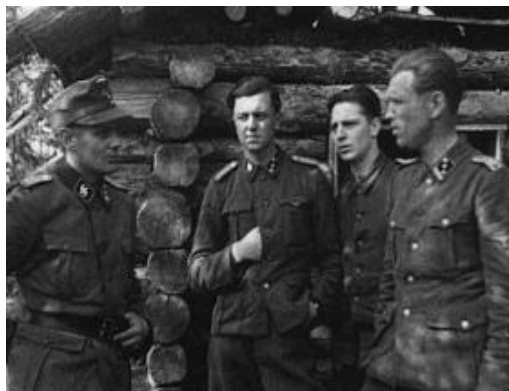
Норвежские офицеры из батальона