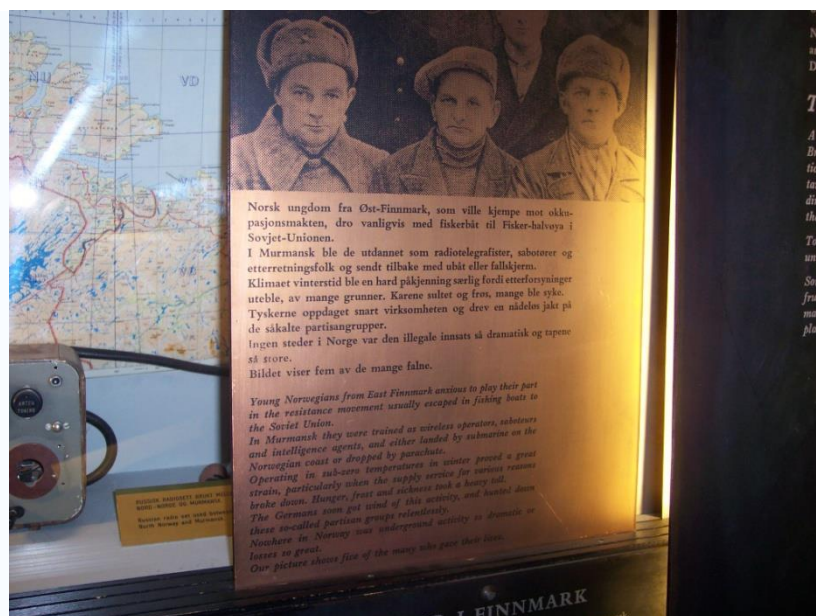
Норвежские диверсанты, прошедшие подготовку на территории СССР (военный музей в Осло, 2006 год)