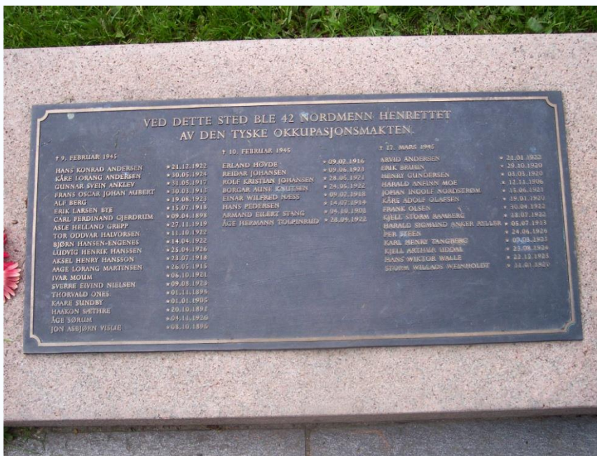
Памятная плита в честь норвежских патриотов, казненных нацистами в 1945-м году (установлена перед входом в военный музей в Осло, фото В. Крупника, 2006 год)

Около 40 000 норвежцев в 1940-45 годах оказались в концлагерях, 19 000 из них содержались в крупнейшем лагере Grini близ Осло. 658 заключенных не вернулись из лагерей, расположенных на территории Норвегии. 9 000 норвежцев находились в лагерях на территории Германии и Польши. 1300 из них, больше половины из которых – евреи -погибли. В настоящее время считается, что всего около 2 000 участников норвежского сопротивления погибли в вооруженных столкновениях, был казнены или умерли в концлагерях.