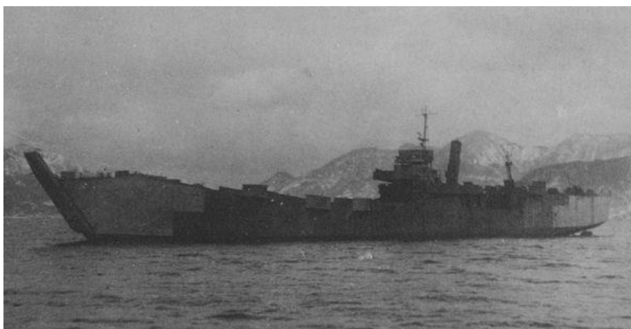
Японский десантный корабль SB

Армия и флот использовали две системы снабжения Иводзимы: (1) Токио-Иводзима – с применением эсминцев, скоростных транспортных судов и судов SB ; (2) Токио-Титидзима-Иводзима – кораблями и быстроходными транспортами, затем на парусниках, рыбацких судах или SB .