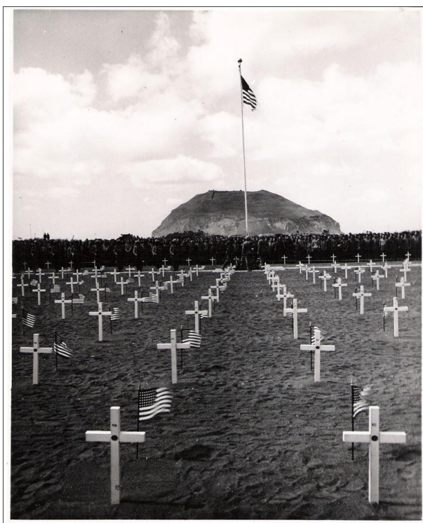
Временное американское военное кладбище на Иводзиме

13 марта, 08.00: Согласно захваченным документам, 3-я, 4-я и 5-я дивизии морской пехоты находятся теперь на севере. 5-я Дивизия – на участке Тензан. 12-го числа только в северном секторе мы нанесли тяжелый урон противнику: 200 человек убито, один самолет сбит.