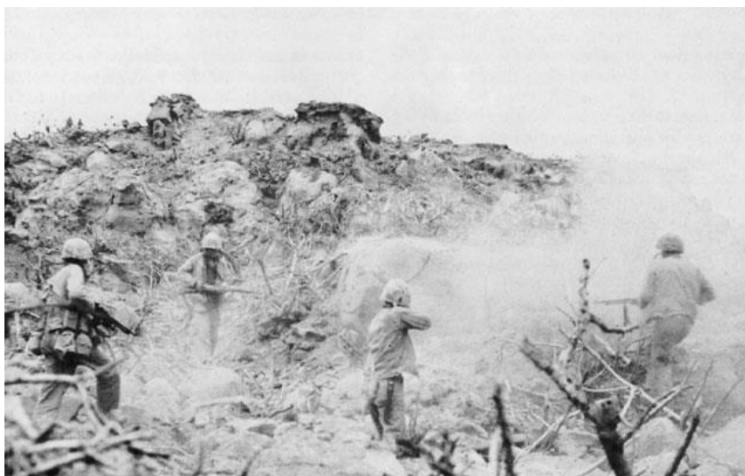
Американские морские пехотинцы у входа в один из тоннелей ( http://ww2today.com/3-march-1945-five-medals-of-honor-on-iwo-jima )

В заключение я хотел бы объяснить, почему японские солдаты не сдаются. С точки зрения ментальности японцев, находящийся на поле битвы японский солдат должен отдать свое тело и душу или победе, или почетной смерти. С древних времен это было традицией, привычкой и общим местом для японских солдат. Если по какому-то стечению обстоятельств военнопленным было суждено вернуться домой, все японцы воспринимали их как трусов. После ВМВ, тем не менее, мнение японцев по этому вопросу полностью изменилось.