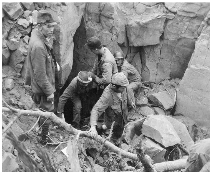
Американцы помогают уцелевшим и капитулировавшим японцам выбраться из пещеры

В заключение я хотел бы объяснить, почему японские солдаты не сдаются. С точки зрения ментальности японцев, находящийся на поле битвы японский солдат должен отдать свое тело и душу или победе, или почетной смерти. С древних времен это было традицией, привычкой и общим местом для японских солдат. Если по какому-то стечению обстоятельств военнопленным было суждено вернуться домой, все японцы воспринимали их как трусов. После ВМВ, тем не менее, мнение японцев по этому вопросу полностью изменилось.