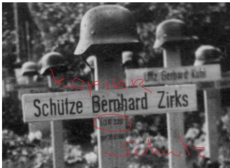
Могилы солдат и офицеров 58-й Пехотной Дивизии Вермахта

Консервированный тунец, галеты, мармелад и масло.