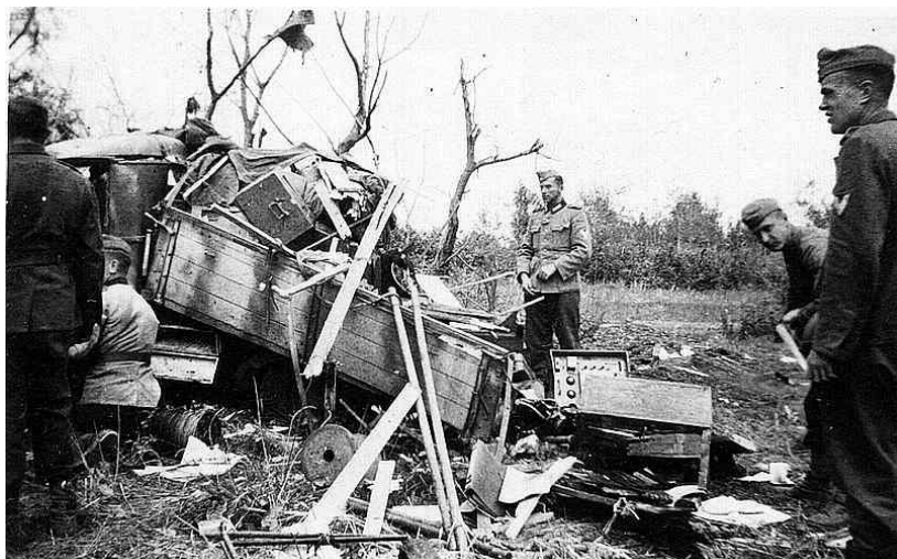
Грузовик с радио- и телефонным оборудованием после прямого попадания артиллерийского снаряда...