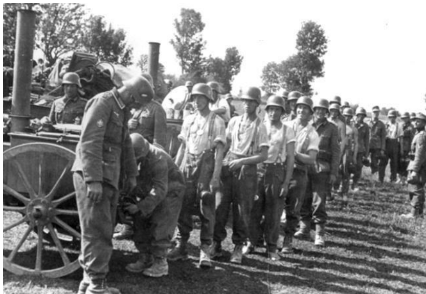
Gulaschkanone и очередь за едой