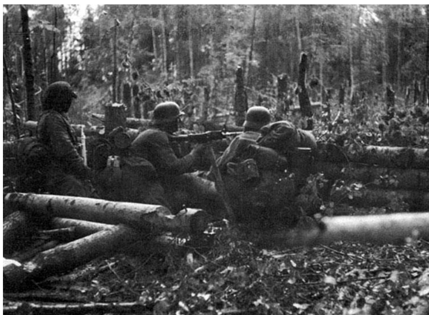
Немецкие солдаты на Воховском фронте

Нас редко к чему принуждали на передовой. Например, я как-то не брился несколько недель в период ожесточенных боев под Волховым зимой и весной 1942 г.