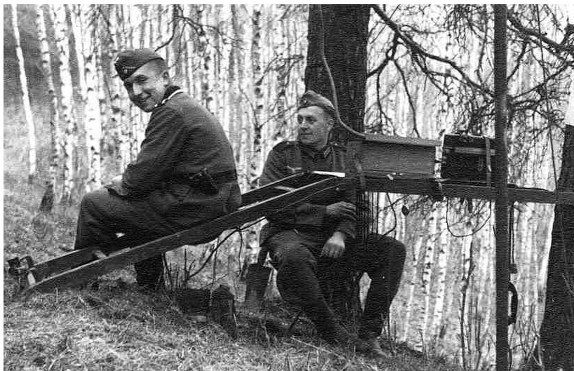
Полевой телефонный узел

До войны, как полагалось всем парням, я побывал в Гитлерюгенде - тебя могли счесть маменькиным сынком, если ты не прошел через это. Но в RAD (Трудовая Служба Рейха – RAD – крупная организация в нацистской Германии, нацеленная на устранение последствий массовой безработицы, милитаризацию и идеологическую обработку трудоспособного населения - ВК) я не был, поскольку работал в Штутгарте в цеху, производившем авиационные приборы. Я надеялся, благодаря этой работе, избежать службы в армии, поскольку тогда все уже хорошо понимали, что такое фронт. Но меня все равно забрили в 1942-м. Было мне тогда 20 лет. Я попал в связисты и служил в 260-м артиллерийском полку. Сами пушкари называли нас Strippenzieher , что означало что-то типа «тянущий провод».