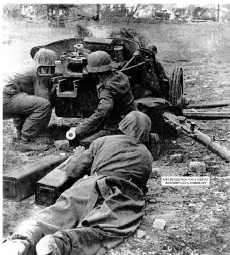
Немецкие артиллеристы в бою