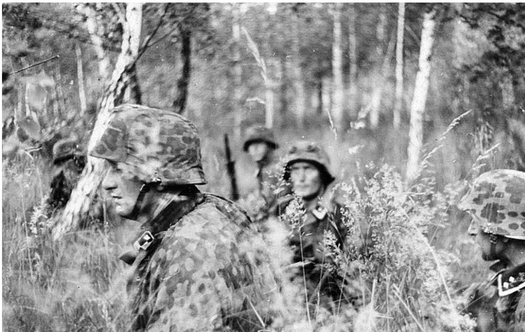
Солдаты дивизии Adolph Hitler на Восточном фронте. Лето 1941 г.