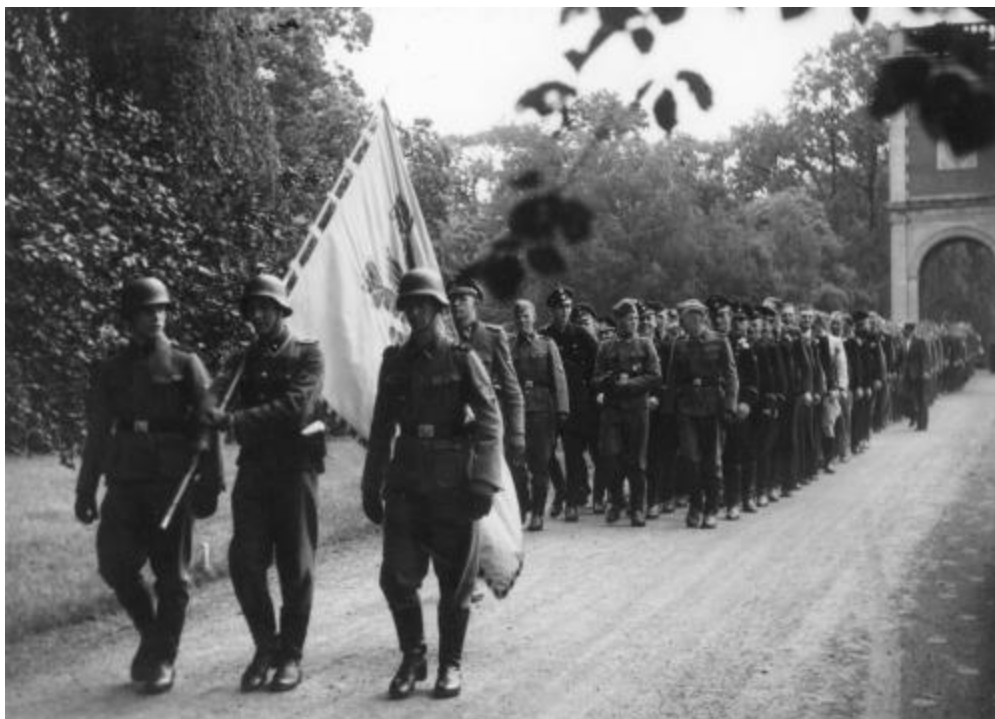
Добровольцы бригады Langemarck в Бельгии незадолго перед отправкой на Восточный фронт (декабрь 1943 г.)