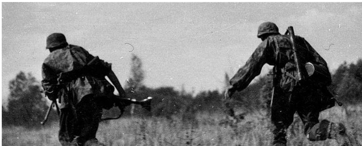
Солдаты дивизии SS Frundsberg в атаке. Восточный фронт ( https://www.pinterest.com/pin/319474167296297567/ )