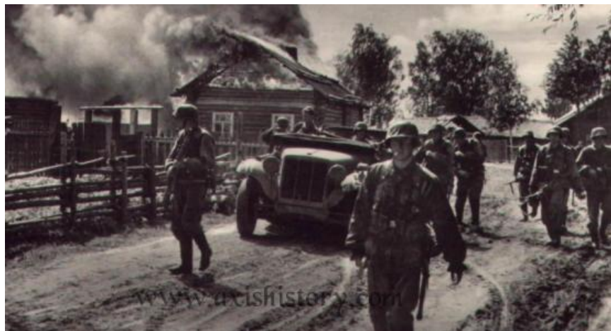
Лето 1941-го. Дивизия Das Reich на марше через горящую белорусскую деревню...