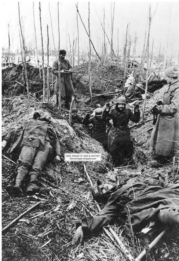
Эсэсовцы сдаются в плен советским солдатам...