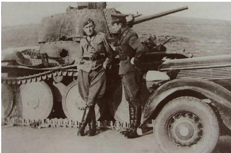
Словацкие танкисты на Восточном фронте. Июнь 1941 г. ( http://forum.axishistory.com/viewtopic.php?t=118811 )