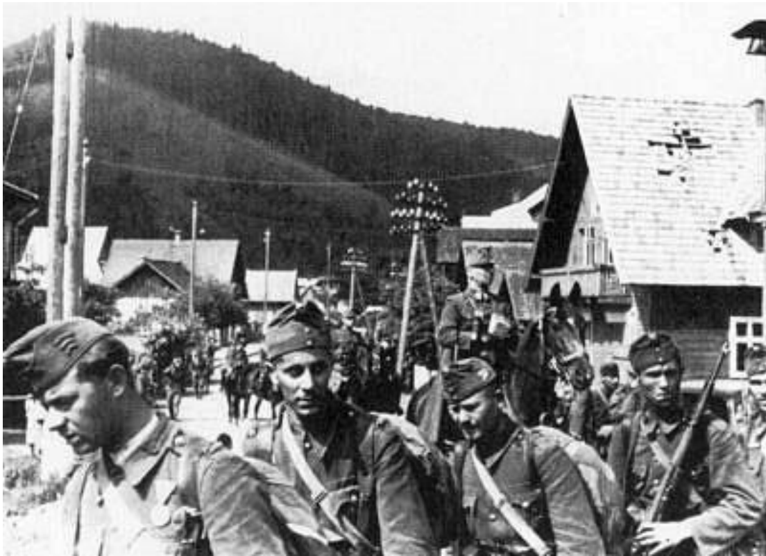
Первые дни войны. Венгерские войска на марше через Карпаты