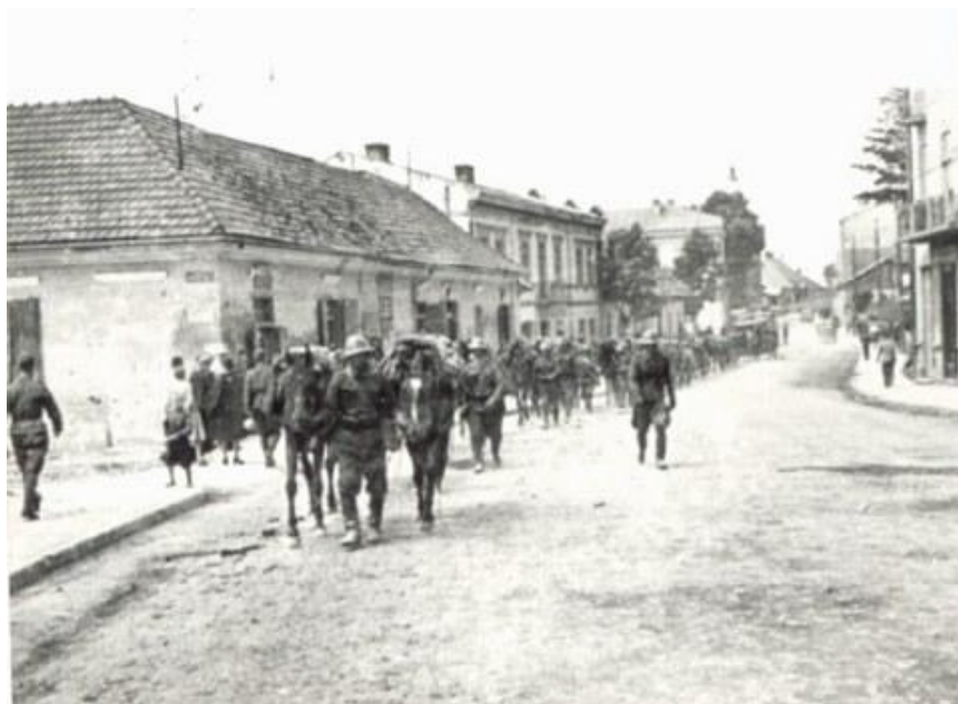
Первые дни войны. Словацкие войска маршируют по улицам города Санок (ныне – юго-восточный угол Польши). Около 7 000 словаков погибли на Восточном фронте. Не менее 3 000 словаков добровольно сдались в плен и позднее более 2 000 из них воевали в составе чехословацких воинских частей на стороне Советской армии... ( http://forum.axishistory.com/viewtopic.php?t=118811 )