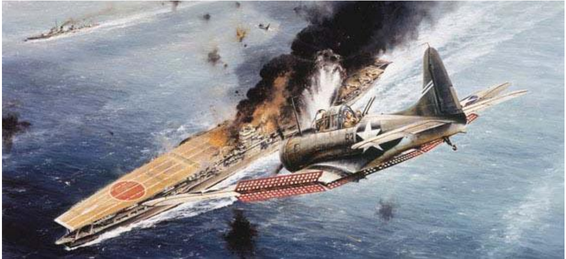
Американский пикирующий бомбардировщик в атаке на японский авианосец (картина)