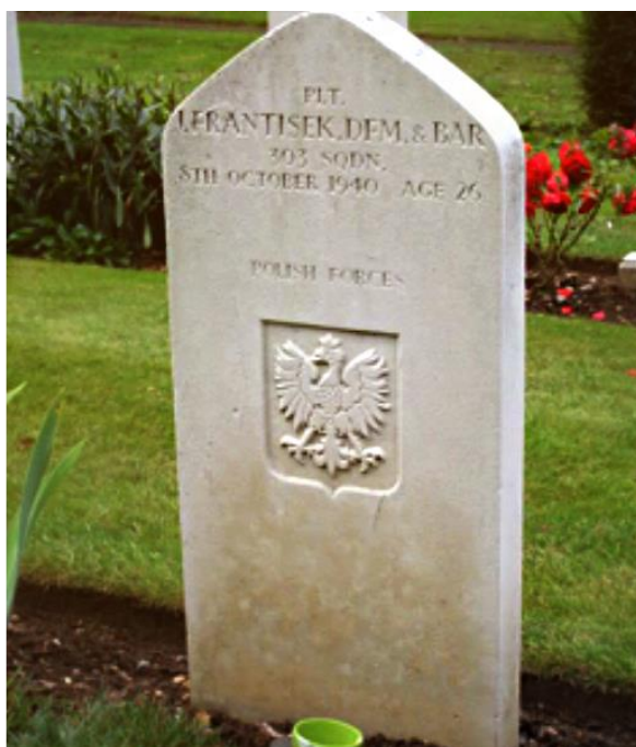
Могила Йозефа Франтишека

Оригинальный текст: Dariusz Tyminski ( http://www.elknet.pl/acestory/frantis/frantis.htm )