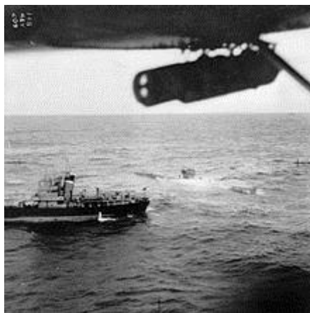
Поврежденная лодка U-570 и один из кораблей КФ. Фотография сделана с борта «Каталины»

В конце концов британским морякам в условиях сильнейшего шторма и далеко не с первой попытки удалось добраться до подводной лодки на спасательном плоту. Группа обыскала лодку в стремлении захватить «Энигму», но, не обнаружив ставшую легендарной шифровальную машину, британцы сняли с U-570 ее экипаж. Лодка была взята на буксир и отконвоирована на базу Þorlákshöfn (Исландия). В короткий срок на лодке была устранена течь и приведена в действие энергосистема, после чего она была переправлена на базу Hvalfjörður для дальнейшего ремонта и подготовки к переходу в Великобританию.