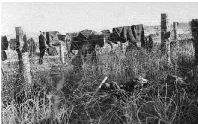
AWM 044172. Наутро после массового побега австралийцы увидели повсеместно валяющиеся трупы японцев вдоль проволочных заграждений, на которых висели шинели и одеяла...