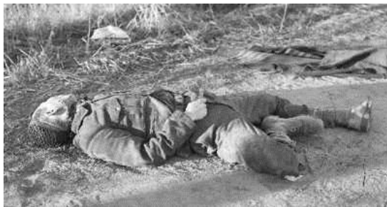
Труп японца, который перезал себе горло во время массового побега...

самоубийству, предпочтя смерть возвращению за колючую проволоку. Двое бросились под проходящий поезд, многие повесились. Когда японцев задерживали, они нередко просили, чтобы их застрелили. Другие сдавались мирно. По меньшей мере, двое японцев были застрелены местными жителями и несколько человек – военнослужащими...