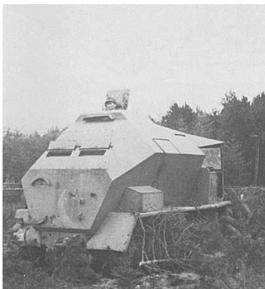
Контрольный пункт на мобильной стартовой площадке

Первый успешный запуск ракеты V-2 был осуществлен в октябре 1942 г., а первое боевое применение – удар по Лондону – датируется 7-м сентября 1944 г. С этого момента и до марта 1945 г. более 1100 ракет V-2 упало на землю Великобритании, в основном, на Лондон и Норвич. Всего в результате этих атак погибли около 2700 человек, вдвое большее число получили ранения. Еще 2000 ракет этого типа были использованы в атаках на цели, расположенные в континентальной Европе, преимущественно, в атаках на Антверпен (Бельгия), находившийся в руках союзников и ставший важным портом для снабжения продвигающихся на восток войск. В конечном итоге, 517 ракет V-2 упало на Лондон и 1265 – на Антверпен.