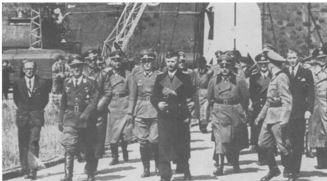
«Отец» ракеты V-2 Вернер фон Браун (Werner Von Braun – второй справа) инспектирует завод по производству ракет в Реепетünde. На этом «предприятии», по разным оценкам, от истощения и болезней умерло от 7 до 20 тысяч заключенных многих национальностей

Эта стабилизированная платформа позволяла контролировать положение ракеты в пространстве и ее ускорение. Платформа оставалась неподвижной и направленной в заданную точку, относительно нее осуществлялись измерения изменений в движении ракеты. В средней части ракетного сопла располагались 4 вертикальных руля, использовавшихся для отражения газовой струи и придания вращения ракете, основываясь на командах, получаемых от системы управления до выключения маршевого двигателя.