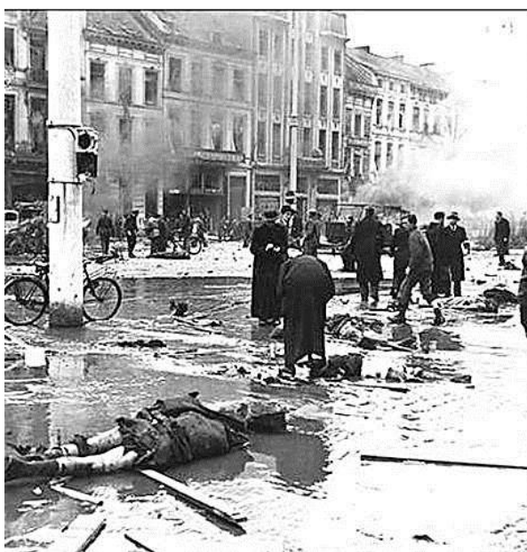
Антверпенская улица после взрыва V-2

Максимальная из упоминающихся в опубликованных источниках цифра погибших в результате этих атак - около 7000 человек.