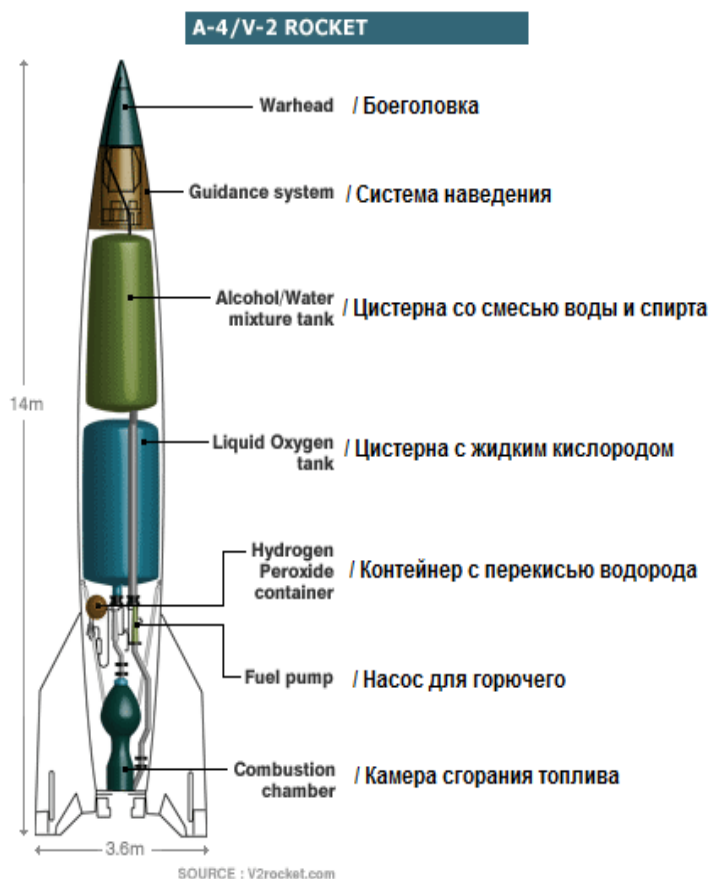
Схема конструкции ракеты V-2

V-2 была первой в мире баллистической ракетой. Она имела длину 14 м и диаметр 1.6 м. Ее поднимал на высоту около 83 км жидкостный реактивный двигатель, который сжигал топливо в течение примерно 60 секунд, а затем отключался. Далее ракета летела к цели по баллистической траектории, определяемой силой гравитации. Максимальная дальность полета ракеты достигала 362 км, вес боеголовки – около 900 кг. Полет на максимальное расстояние занимал около 5 минут. Система наведения, посылающая ракету в нужном направлении, носила название инерционной. Она обеспечивала фиксированное положение стабилизированной платформы в пространстве независимо от колебаний положения самой ракеты относительно платформы.