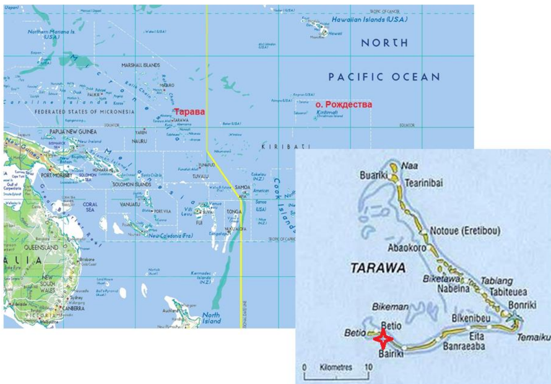
Схематическая карта положения атолла Тарава в бассейне Тихого океана и карта атолла (остров Бетио – участок боев)