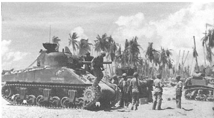
Танк Колорадо, по-видимому, вскоре после окончания последнего боя. На заднем плане – легкие танки Стюарт ( http://tarawaontheweb.org/usmctank.htm )

Зачистка острова завершилась на следующий день, 23 ноября, к 13.30. С японской стороны в боях за Тараву уцелели лишь один японский офицер, 16 солдат и 129 рабочих-корейцев. Морская пехота США потеряла в боях 990 человек убитыми, умершими от ран и пропавшими без вести.