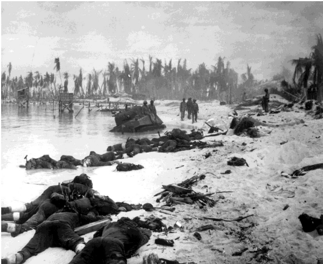
Знаменитая фотография – морские пехотинцы, погибшие при высадке на атолл Тарава. На заднем плане – один из свалившихся в воронку танков Шерман, вышедших из строя на ранней стадии высадки ( http://tarawaontheweb.org/usmctank.htm )

Победа была достигнута американцами за счет больших потерь, но здесь была выработана тактика взаимодействия танков и пехоты при преодолении защищенного многочисленными огневыми точками острова. Этот опыт пригодился американцам позднее.