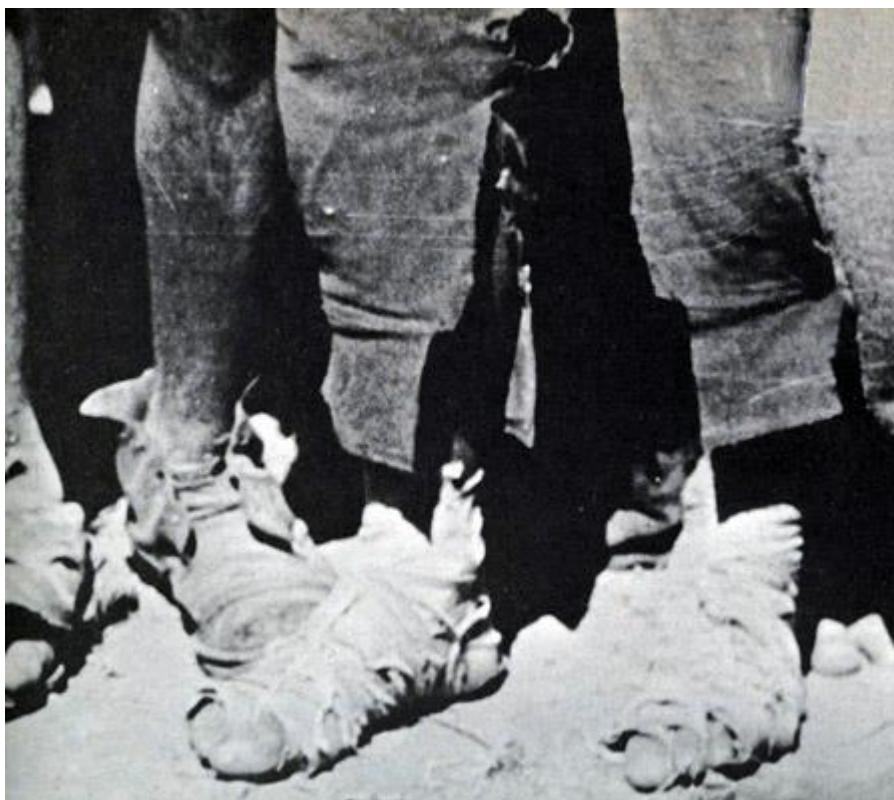
Некоторые сцены этой войны напоминали Сталинград

Тем временем на приморском участке фронта итальянцы продолжали продвигаться вперед. 8 ноября они вышли к долине реки Ачерон (Acheron), но успехи греков на центральном участке фронта делал их позицию довольно опасной и чреватой окружением, и 13 ноября итальянцы начали отвод своих войск на этом участке. В тот же день греки с радостью встретили первую группу албанских дезертиров, рвущихся в бой против своих итальянских хозяев. Они сформировали ядро Албанского Легиона, который позднее участвовал в боях на стороне греков.