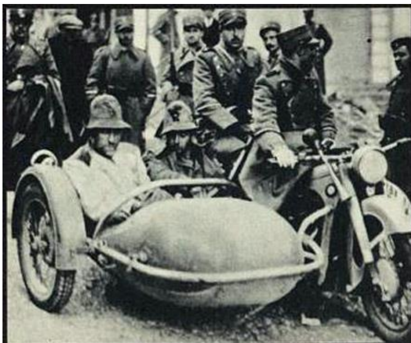
Пленный итальянский полковник

К тому времени группировка итальянских войск в Албании включала в себя 9-ю Армию: 8 дивизий, в том числе 1 танковая, всего до 200 тыс. чел.; 250 танков, 700 орудий, 400 самолётов. Греция имела на границе, кроме пограничных частей, 2 пехотных дивизии и 2 пехотных бригады Эпирской армии генерала Папагоса, в которых насчитывалось 27 тыс. чел., 20 танков, 70 орудий и 36 самолётов.