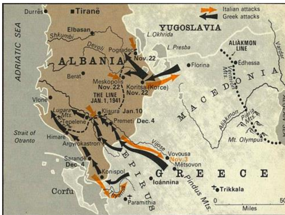
Карта боевых действий

союзникам в том случае, если ситуация в Греции и Румынии потребует их оперативного вмешательства. Существовавшие в прошлом сомнения, распространенные в балканских странах по отношению к способности союзников выполнить свои обещания, теперь усилились, и вслед за поражением Франции Румыния заявила о том, что она перестает признавать англо-французские гарантии. Турция, которая к тому времени воздерживалась от заявлений о своем нейтралитете, поспешно объявила о своем невмешательстве. Турецкая декларация, после которой, по его мнению, Греции уже не приходилось рассчитывать на помощь союзников, окончательно вдохновила Муссолини на вторжение в эту страну.