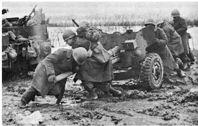
Американские артиллеристы пытаются управиться со своим 57-мм противотанковым орудием (вес – 1140 кг)