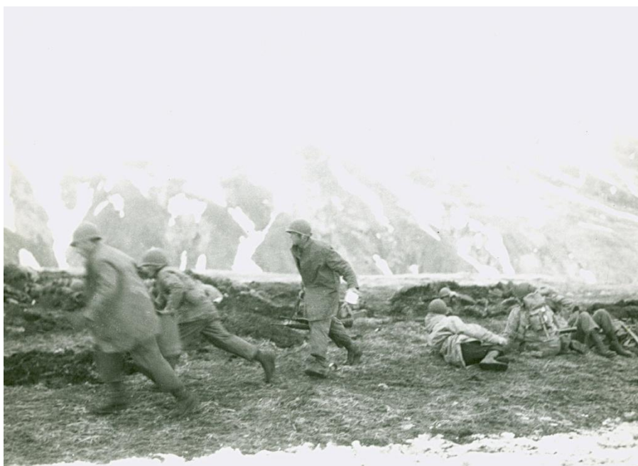
Американская пехота под огнем

В конце концов, стрелковый взвод американцев прорвался к господствующей высоте гряды Мооге. Около 45 японцев по предводительством размахивающего саблей офицера предприняли попытку вернуть высоту, но эта атака была отбита.