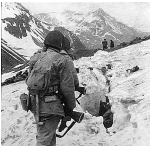
Американцы продвигаются вперед. Типичный ландшафт зоны военных действий

Западный фланг перевала Clevesey открывал путь к вершинам, господствующим над гаванью Чикаго. Над восточным флангом перевала, откуда открывался выход в долину Сарана (Sarana), господствовала вершина Engineer Hill. Все господствующие высоты на пути к гавани Чичагова были заняты японцами, и следующие несколько дней американцы провели в попытках выбить противника с оборонительных позиций.