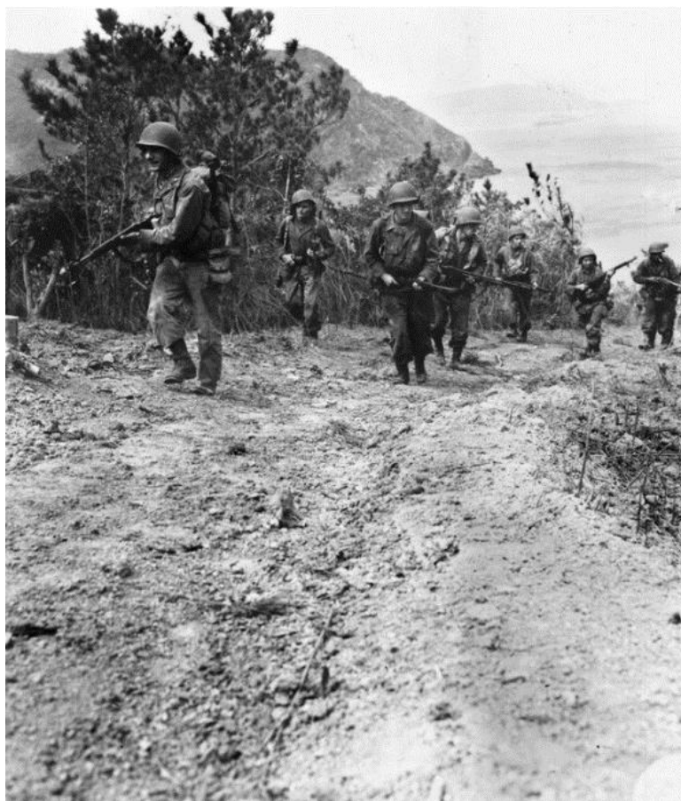
Авангард десантников осторожно продвигается по одной из троп острова Токашики.

Тем временем 3-й Батальонный Отряд на острове Ака столкнулся с упорным сопротивлением японцев, засевших на одной из многочисленных скалистых гряд острова на хорошо подготовленных позициях. Хорошо вооруженные минометами и пулеметами примерно 75 японцев держали оборону до тех пор, пока не пришла поддержка с воздуха. Бомбардировки, пушечно-пулеметный и ракетный обстрел с воздуха сбили японцев с гряды.