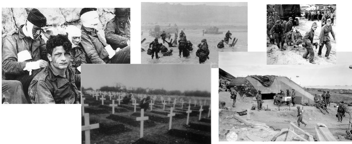
Отаха Вич – слева направо: верхний ряд - раненые американцы, высадка, пленные немцы, нижний ряд - военное кладбище рядом с местом высадки, захваченный дот