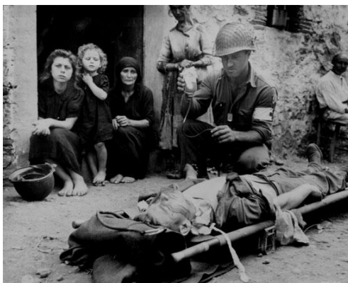
Сицилия, 1943. Санитар оказывает помощь раненому американскому солдату. Местные жители с состраданием наблюдают...

После Сицилии, зимой 1943-го, когда у нас уже был опыт, мы были обстреляны в боях и приобрели хорошую репутацию, нас вернули в Англию. Наша база находилась в приморском городе Weymouth, где мы начали готовиться к высадке в Нормандии. Нам сказали, что мы будем брать доты, и разделили не на взводы, а на отделения. В каждом отделении были стрелки, пара ребят обучались применению так называемых bangalore torpedoes , многие обучались использованию толовых шашек. Bangalore torpedoes – это длинные трубы с динамитом внутри. Просовываешь одну секцию под колючую проволоку, толкаешь ее вперед. Затем прикручиваешь к первой вторую и толкаешь еще дальше, затем третью и так далее. В последнюю вставляешь