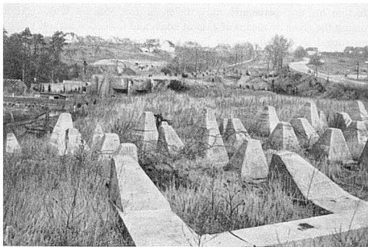
Ziegfried Line - Линия Зигфрида. На переднем плане бетонные надолбы (Dragon's Teeth - Зубы Дракона), на дальнем - доты